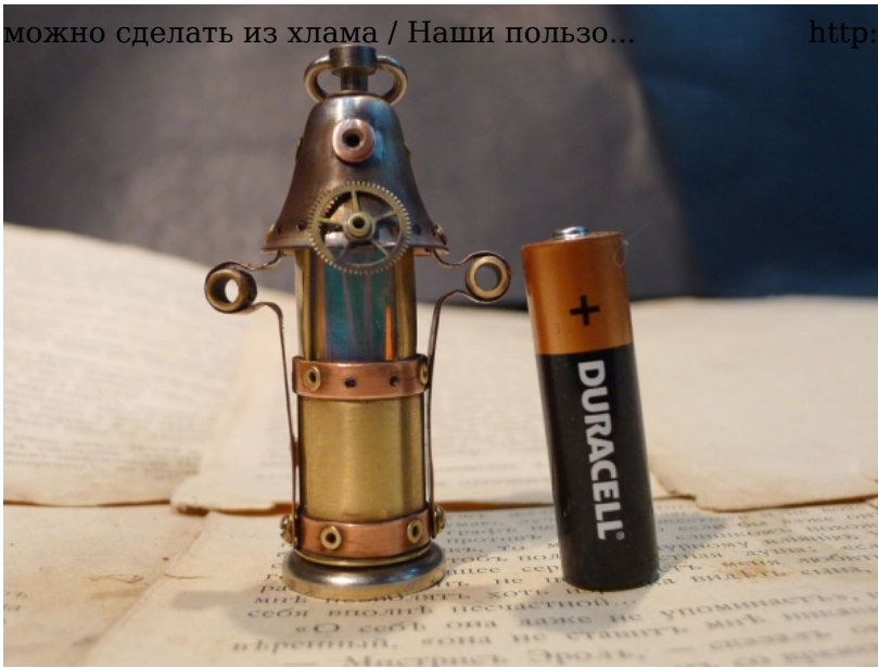
Зеленый диод фирмы «Фосфорный Джо» имитирует пламя карбида, видимое сквозь фальшивый изумруд