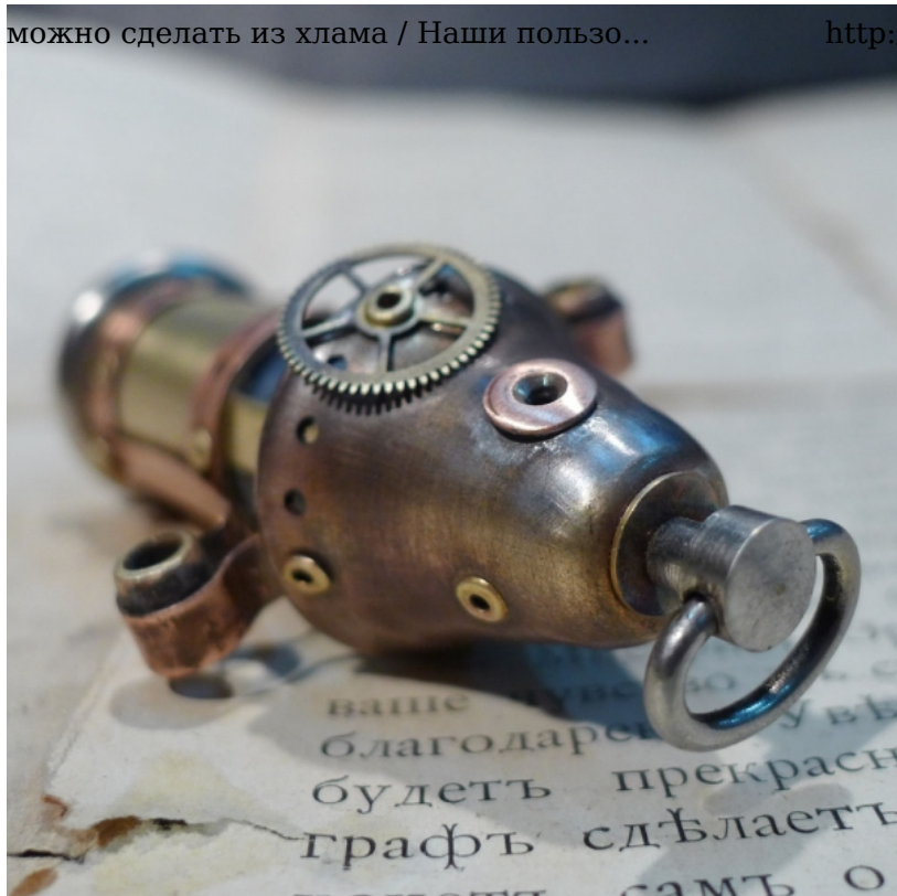
следы припоя имитировал серебряной акриловой краской фирмы «Ван Гог». Дорогущая зараза!